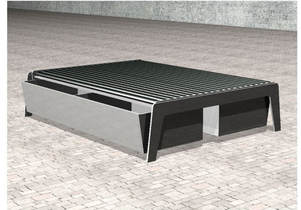
3 D Studienmodell / Entwurf 2006 CTH GmbH