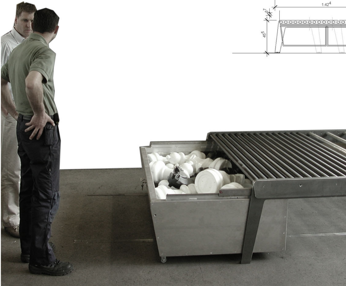
Prototyp Bemusterung Burri AG 2. Mai 2007

Farbkonzept Antrazit Dunkel: Bankelement Antrazit hell: Schublade