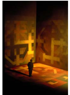
Aussenrauminstallation, begehbare Bildraum, 5 m x 5 m x 5 m, Sechs Leinwände, doppelt bespannt, Acryl auf Leinwand, Titanweiss, Oxydpigmente.